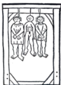
Epitaphe d'un d'élite

泥棒詩人ヴィヨンのトリスタンとイゾーの悲恋伝説などフランス中世文学に魅了され、その研究によって日本の外国文学研究を世界水準にまで高めた佐藤輝夫（1899-1994年、徳島市出身）。その生涯と業績をたどります。