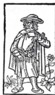
L'homme d'élite voit à son adversaire le meilleur adversaire qu'il a jamais eu.